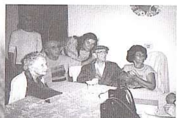
Aspectos de diversos momentos em companhia de amigos e pessoas que o procuravam