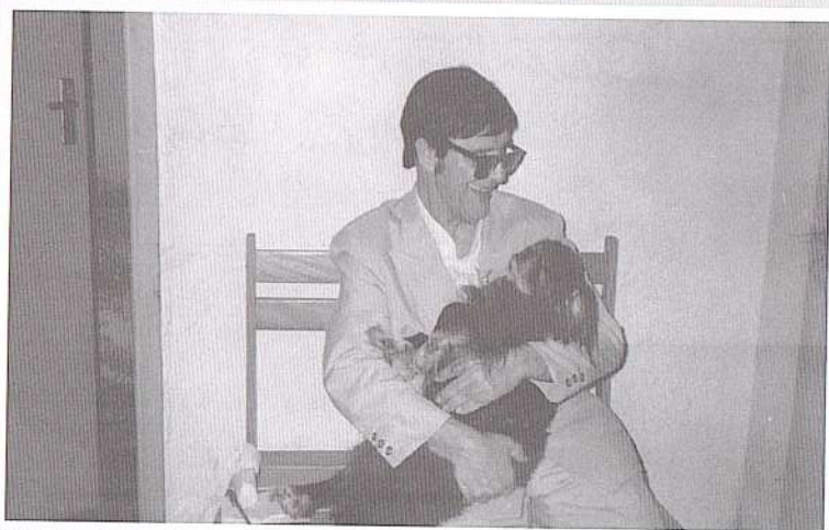
Chico mostrando o seu amor com brinquinho em seu colo.