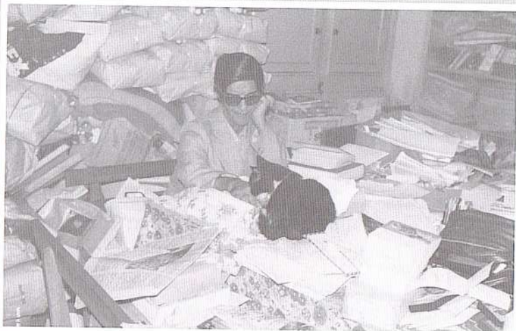
Chico como sempre, não deixava de considerar os seus animalzinhos querendo-os sempre ao seu redor, mesmo estando em serviço.